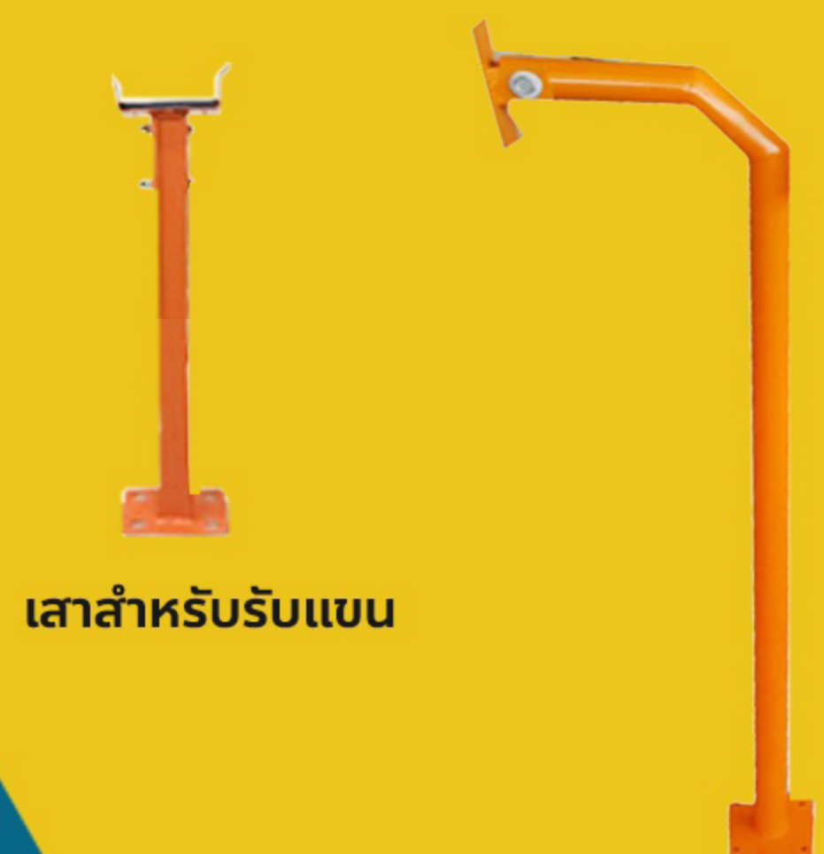
เสาสำหรับรับแขน

แขนไม้กั้น 6 เมตร (3เมตร x2 ท่อนๆ3เมตร) สำหรับ HV-BR04, HV-BR06